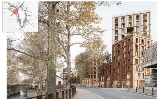
S'inscrire dans le déjà- là...