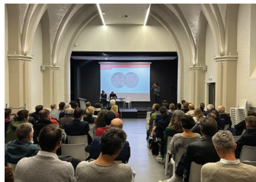
Projection du nouveau visage de l'avenue de Lyon, dont l'aménagement doit faire signal pour le projet de long terme (gauche); une présentation/débat suivie par de nombreux adhérents d'AMO-OMP (droite).

D'où une stratégie d'épannelage entre quartiers et faisceau selon laquelle les unités de plus grande échelle seraient ancrées au second plan. Enfin, la réintroduction de la nature en ville serait portée par une importante végétalisation (nouveaux parcs, voirie arborée), en accroche avec le projet Grand Parc Canal.