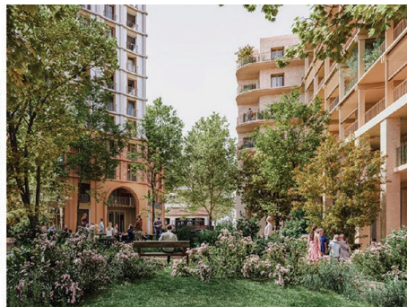
... et diffuser l'ambiance du canal en cœur d'îlot

Nouvelles ambiances dans une perspective de continuité entre le centre-ville et le faubourg et de pénétration de la nature dans les cœurs d'îlots.