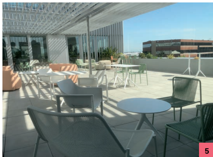
Vues intérieures : une petite place végétalisée au cœur du bâti (4) ; une grande terrasse assure une transition douce entre moment de travail et moment de loisir (5) .

Le nouveau campus répond aussi à des enjeux fonctionnels au regard notamment des évolutions techniques, organisationnelles, de confort (3) : « Les salariés ont été accompagnés afin de prendre place dans un espace destiné à favoriser le travail partagé, très flexible, et aussi beaucoup plus confortable. Le projet a été co-construit avec eux, en fonction de leurs besoins. Ils souhaitaient, par exemple, beaucoup de biophilie : d'où la forte présence du végétal à l'intérieur du bâti » [Florian Rigaud]. Outre l'espace nécessaire de restauration, les occupants disposent d'une cafétéria, d'un work-café, d'une bibliothèque-ludothèque, d'un espace Zen de détente. C'est en 2023 que l'opération a pris un tour véritablement concret, via l'accord passé avec la foncière de développement immobilier 3R, alors propriétaire du site et qui avait déjà profilé un projet avec l'agence d'architecture ppa : « Pour nous, le projet a commencé en 2019. Nous avons acheté le site avec l'intention de le restructurer. Puis il y a eu l'épisode Covid. Les bâtiments existants ont été loués par Airbus, sans l'occuper, jusqu'en fin 2022. Nous avons pu revenir à notre idée initiale et, notamment, détruire deux immeubles et un parking silo » [Jean-Christophe Rumeau, Directeur général Groupe 3R].